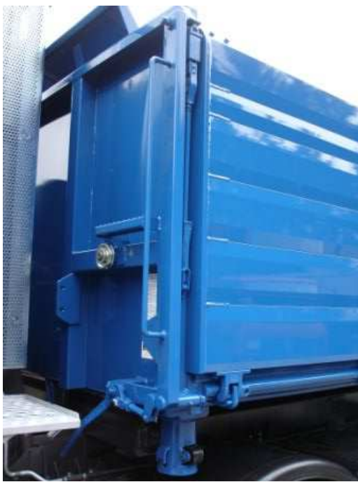
65mm schwere Kipperbordwand mit „Einhand-Federunterstützung“