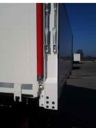
Baustoffpritsche mit Federunterstützung vorne und hinten